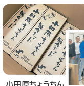
小田原ちょうちん 製作指導教室