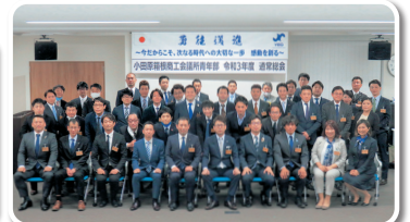
令和3年度 通常総会