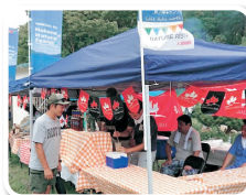
ネイチャーフェスタ